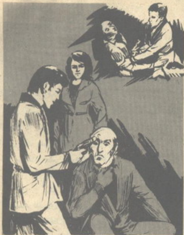
ثم صوّب المسدس إلى رأس الرجل ، وقال بحزم : « من الذى أرسلك إلى هنا يا صديقى القصير ! » ..

ثم صوّب المسدس إلى رأس الرجل ، وقال بحزم : — من الذى أرسلك إلى هنا يا صديقى القصير ؟ رفع الرجل عينيه إلى السقف ، وظهر العناد على ملامحه ، ولم ينس بيت شفة .. ابتسم ( أدهم ) ، وقال : — يسعدنى دائماً التعامل مع مثلك من الرجال .. هؤلاء الذين يصرّون على الصمت . ثم قال له ( منى ) دون أن يرفع عينيه عن الرجل : — أغلقتى عينيك يا عزيزتى .. فأنا أشفق على فتاة مثلك ، أن تشاهد رجلاً تفجر رأسه برصاصة . شحب وجه القصير ، وقال بتلعثم : — إنك لن تجرؤ .. لن تستطيع .. سحب ( أدهم ) صمام الأمان إلى الوراء ، وألصق المسدس بجبهة الرجل وهو يقول بلا مبالاة : — ستخبرك الشياطين فى الجحيم يا صديقى أننى جرؤت على ذلك .